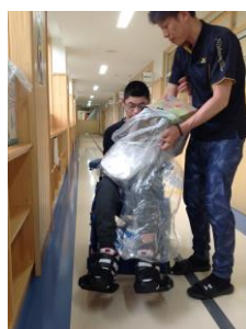
●牛乳パックの回収