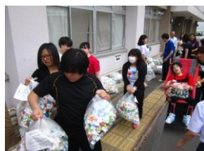
●エコキャップキャンペーン