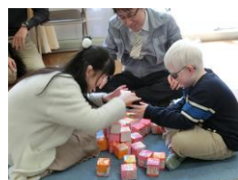
●牛乳パックでの積み木の積み上げ