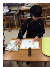
●使用済点字用紙でしおり作り